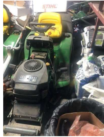
Imagem 6 - Trator Corta-Relva John Deere LTR 180