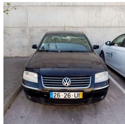
Imagem 10 – VW Passat matrícula 26-26-UI