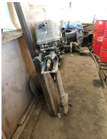
Imagem 16 - Motor de embarcação Tohatsu