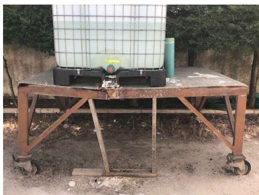
Imagem 14 - Estrutura Metálica (sem depósito)