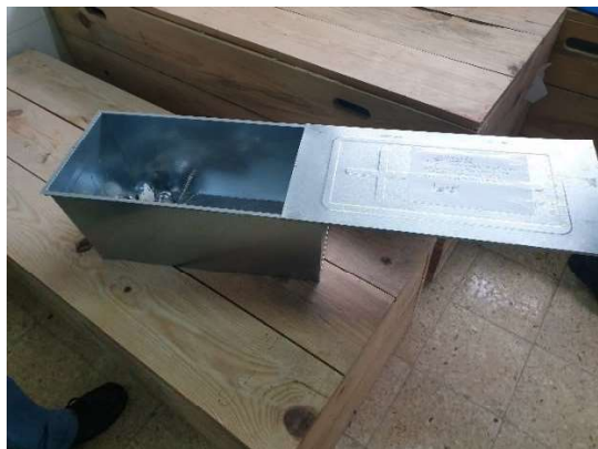
Imagem 13 - Diverso Material Anatômico em Liga de Titânio