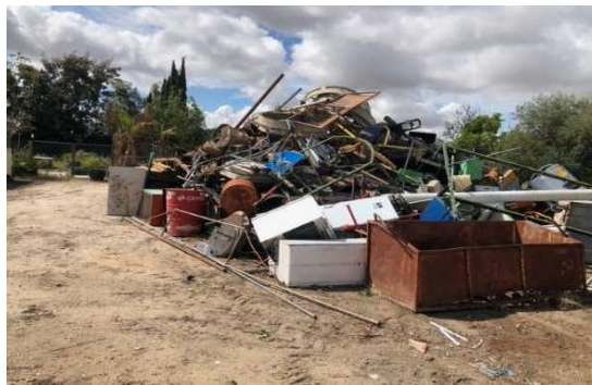
Imagem 12 - Sucata Diversa