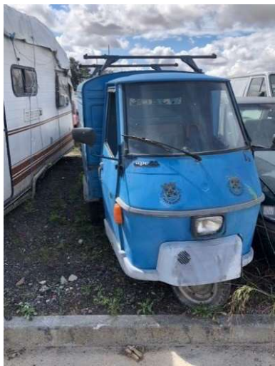
Imagem 1 - Triciclo Piaggio APE50