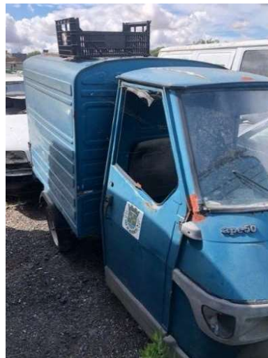
Imagem 2 - Triciclo Piaggio APE50