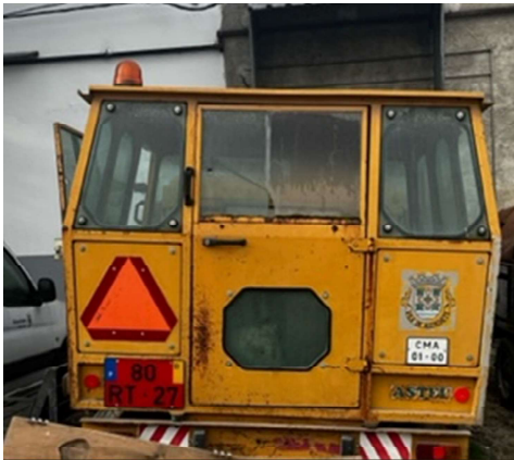
Imagem 7– Dumper Astell Jupiter matrícula 80-RT-27