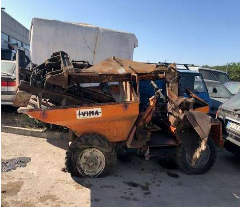
Imagem 5 – Dumper Vima