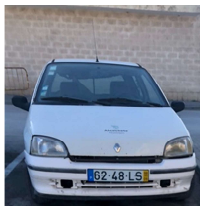
Imagem 4 – Renault Clio matrícula 62-48-LS