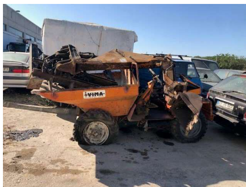
Imagem 15 – Braço de Grua (sem Dumper)