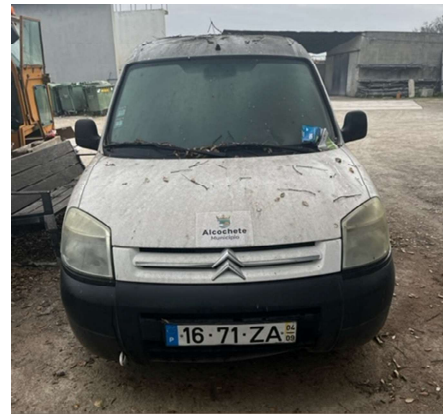
Imagem 8 – Citroen Berlingo matrícula 16-71-ZA