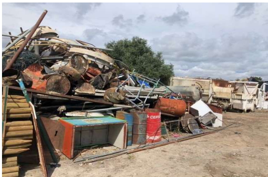
Imagem 11 - Sucata Diversa