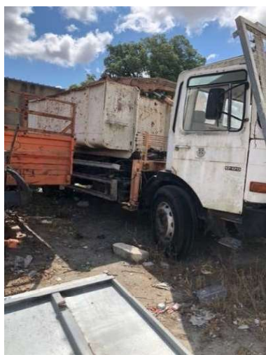
Imagem 3 - MAN 1670F matrícula 30-68-JU