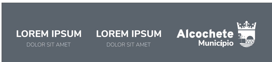
Negativo sobre fundo escuro