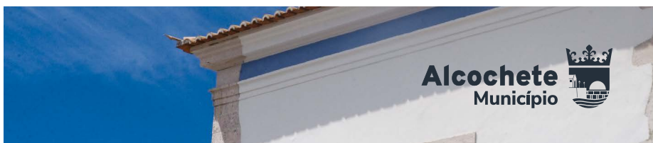
Monocromático sobre fundo fotográfico