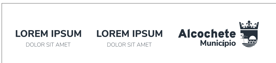
Monocromático sobre fundo branco